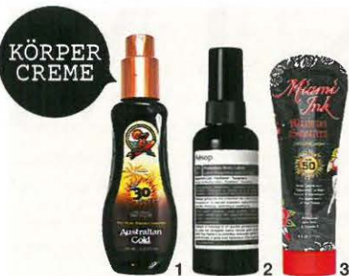
KÖRPER CREME 1 AUSTRALIAN GOLD „SPF 30 Spray Gel with Instant Bronzer“, wasserfest, 125 ml, ca. 16 € 2 AÉSOP „Protective Body Lotion“, SPF 50, 150 ml, ca. 33 € 3 MIAMI INK „Maximum Sunscreen Lotion SPF 50“, Tattooschutz, 177 ml, ca. 19 €

Wann sollte ich aus der Sonne gehen? Selbst bei Schutzfaktor 50 ist Sommer Sonne zwischen 11 und 15 Uhr besonders für helle Typen zu meiden.