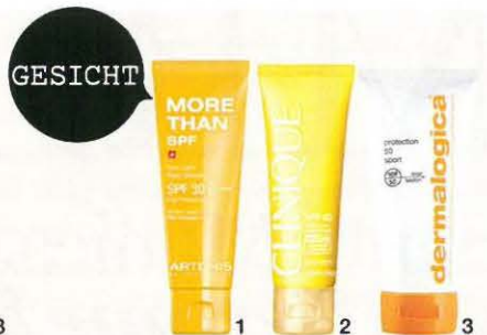
GESICHT 1 ARTEMIS „More Than SPF Face Cream SPF 30“, 50 ml, ca. 20 € 2 CLINIQUE „Face Cream with SolarSmart SPF 40“, 50 ml, ca. 25 € 3 DERMALOGICA „Protection 50 Sport SPF 50“, 156 ml, 40 Min. wasserabweisend, ca. 43 €