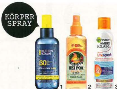
KÖRPER SPRAY 1 BIOTHERM HOMME „UV Defense Sport SPF 30, invisible Spray“, 125 ml, ca. 26 € 2 HEI POA „Huile Sèche au Monoï SPF 30“, 150 ml, ca. 19 €; ges. b. niche-men.com 3 GARNIER „Ambre Solaire UV Sport 50“, 200 ml, ca. 11 €