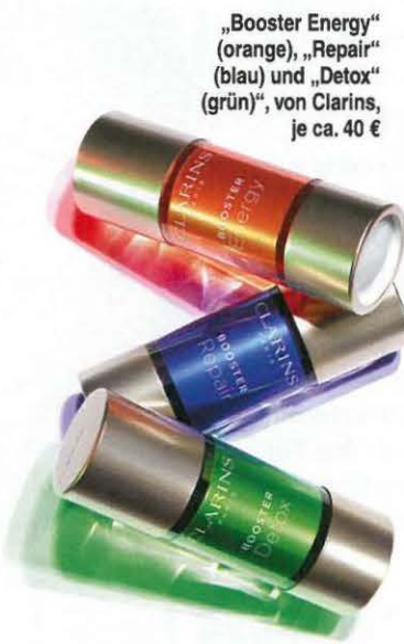
„Booster Energy“ (orange), „Repair“ (blau) und „Detox“ (grün), von Clarins, je ca. 40 €

Power-Shots Ein bisschen Energie gefällig? Oder lieber das Detox-Programm? Ein paar Tropfen der cleveren Booster in Ihre gewohnte Creme geben, und schon strahlt der Teint wieder wie neu