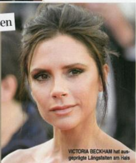
VICTORIA BECKHAM hat ausgeprägte Längsfalten am Hals