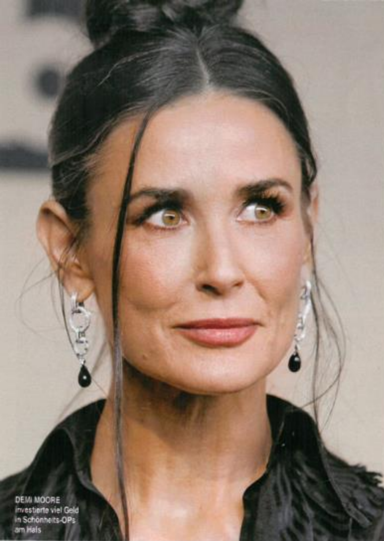
DEMI MOORE investierte viel Geld in Schönheits-OPs am Hals