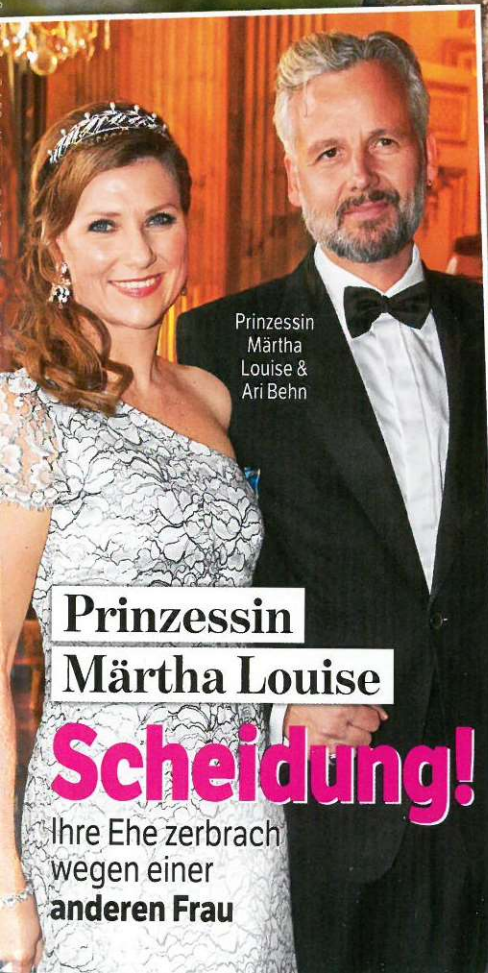
Prinzessin Märtha Louise & Ari Behn