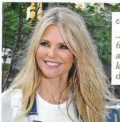
CHRISTIE BRINKLEY ...