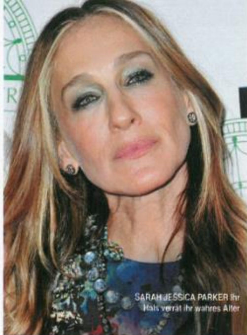
SARAH JESSICA PARKER Ihr Hals verrät ihr wahres Alter